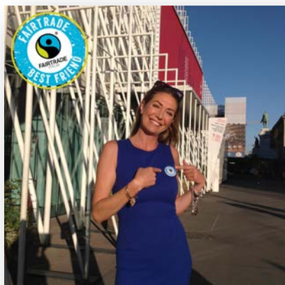
TESSA GELISIO , food blogger, conduttrice tv e nostra Fairtrade Best Friend www.instagram.com/tessagelisio