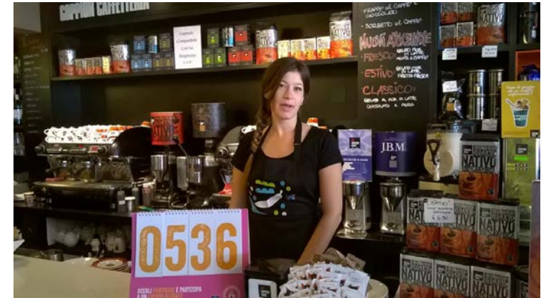
Nel 2017 la sfida tra locali è stata vinta dalla caffetteria Goppion di Padova.