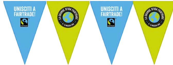
Bandierine (filare da 6 metri)