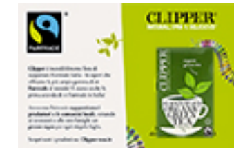
Cartolina con bustina di tè verde Clipper