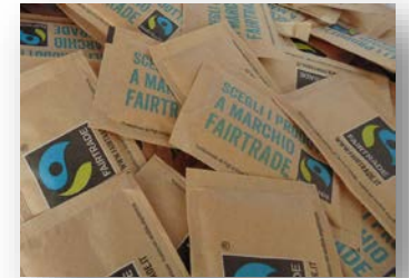
Zucchero di canna in bustine