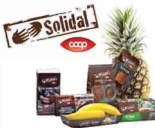
1 acquista un prodotto Coop Solidal

Si tratta di una scelta sempre più condivisa dagli italiani, come confermano le ricerche di mercato più recenti. Lo scorso anno un'indagine Nielsen ha misurato la propensione all'acquisto di prodotti etici nel nostro Paese, evidenziando una maggiore preferenza per quelli del commercio equo e solidale , cresciuta dal 23% del 2014 al 29% dell'inizio 2018. Dunque l'offerta equo-solidale cresce perché nel corso degli anni il marchio Fairtrade si è affermato con prodotti di ottima qualità, buoni e sicuri. Metti nel carrello prodotti che fanno la differenza e scegli un consumo più consapevole. Una spesa più solidale è possibile. ■