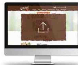
3 carica la foto sul sito