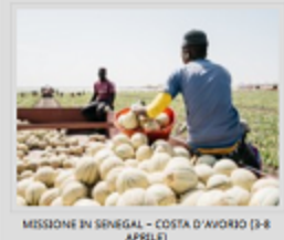
MISSIONE IN SENEGAL - COSTA D'AVOIRO (3-8 APRILE)