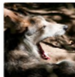
Danimarca, torna il lupo dopo 200 anni