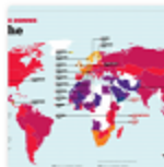
MAPPA / Parità di genere, questa sconosciuta