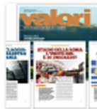
Valori maggio: viaggi, stadio, marijuana e...