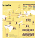
Mappa / Cioccolateria globale