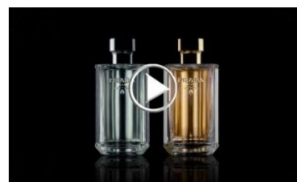
Prada - L'Homme La Femme