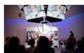
L'Oréal, Martinez-Rumbo: Terza divisione per fatturato