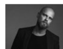
Estée Lauder, Trotter alla guida di Jo Malone London