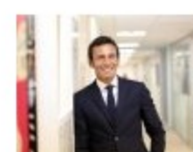
Cambi ai vertici di Shiseido Italia