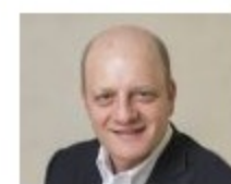
Pane nominato CEO di Coty