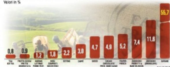
VOLUMI DI PRODOTTO EQUOSOLIDALE VENDUTO IN ITALIA E CERTIFICATO FAIRTRADE