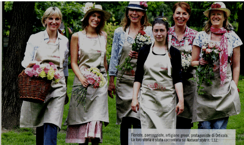
Fioriste, paesaggiste, artigiane green, protagoniste di Orticola. La loro storia è stata raccontata su Natural style n. 132.